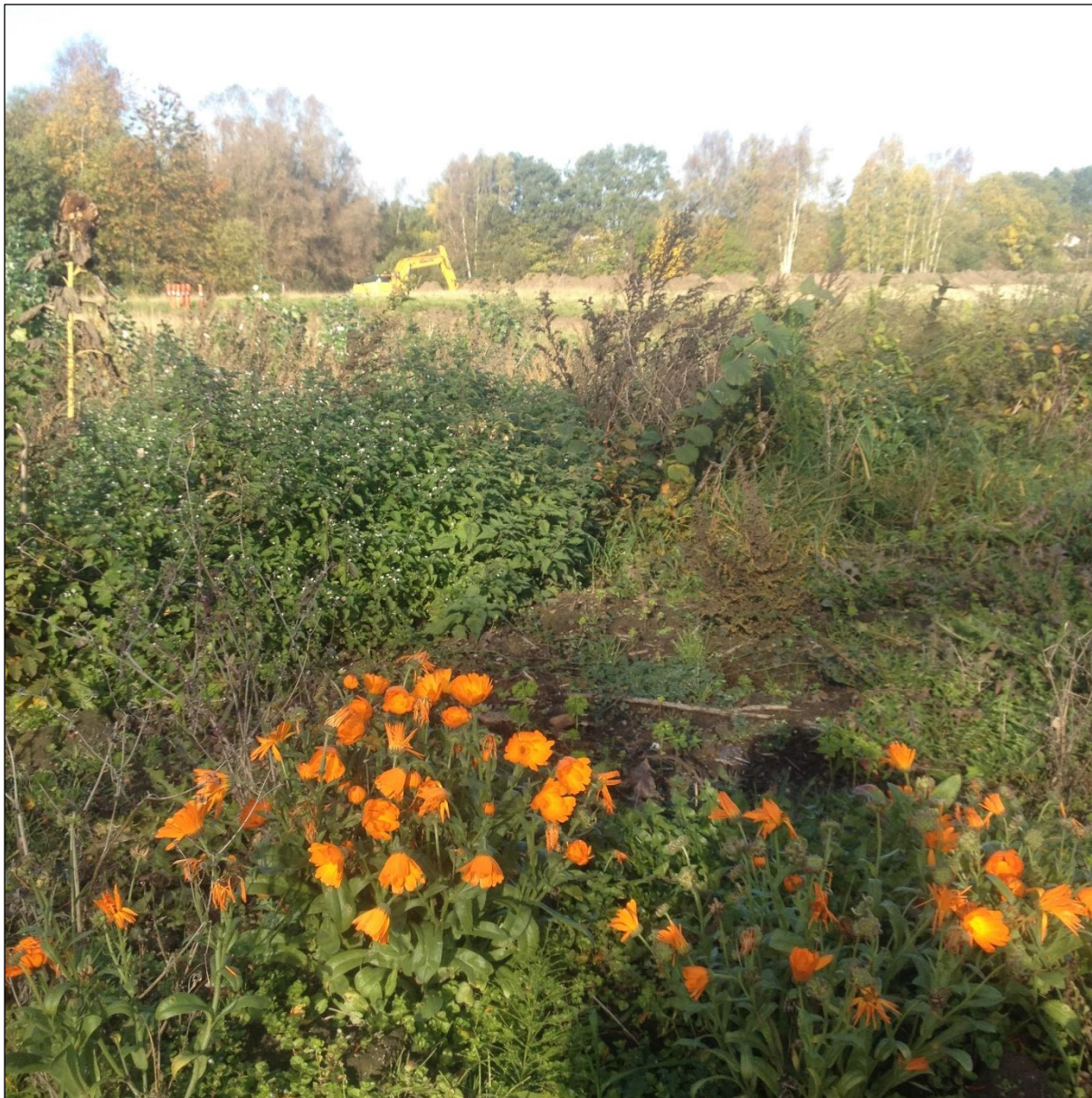
Figur 6. Gravemaskinen bag ved de blomster, der stadig stod i nyttehaverne i efteråret.

Der blev ikke registreret anlæg af arkæologisk interesse ved forundersøgelsen på Kærsmindbadet, så der skal ikke foretages en egentlig udgravning på området.