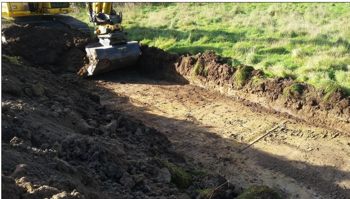
Figur 4: Undergrunden bestod af let sandet ler, flere steder med mange sten og indslag af grus.

Kærsmindeområdet ligger på et plateau, der mod vest skræner let ned mod Oust Møllebæk. Undergrunden bestod af let sandblandet ler med en del sten. De fritlagte grøfter blev meget fedtede og glatte i vådt vejr.