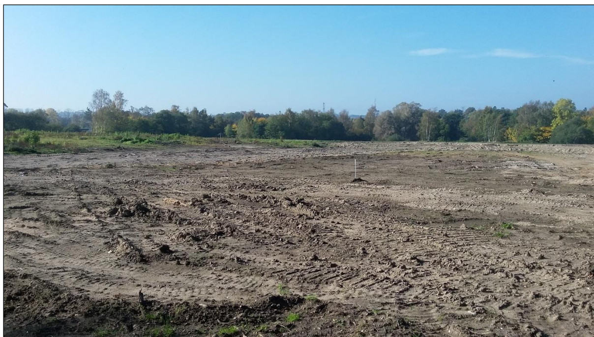
Figur 3: Den del af området, hvor der før nedrivningen, var bygninger og vejadgang. Bagerst i billedet til højre ses resterne af nyttehaverne. Set fra øst.