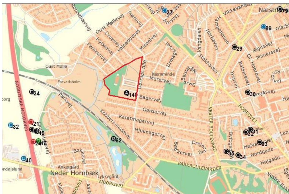
Fig. 1 MOE932 Kærsmindebadet ses markeret med rød streg og med nr. A149 ved Gørrilds Allé

Forud for et større byggeprojekt på grunden, hvor det nu nedlagte Kærsmindebad har ligget, ønskede Randers Kommune en forundersøgelse på arealet. Der er ikke tidligere registreret fund eller foretaget udgravninger på området. Umiddelbart syd for området er der tidligere fundet en tysk sølv mønt fra senmiddelalderen (-62). Ved Oust Møllevej vest for Kærsmindebadet er der undersøgt bevarede fortidsminder fra flere forhistoriske perioder. Bl.a. kulturlag og flint fra den tidlige del af bondestenalderen (-21, -24), samt en hustomt og kogestensgruber fra bronzealderen (-47). Nordøst for planområdet er der fundet en jordfæstegrav fra ældre jernalder samt spor efter bopladsaktivitet fra samme periode (-37, -89). Desuden er området øst for Kærsmindebadet præget af gravhøje, der ikke er dateret.