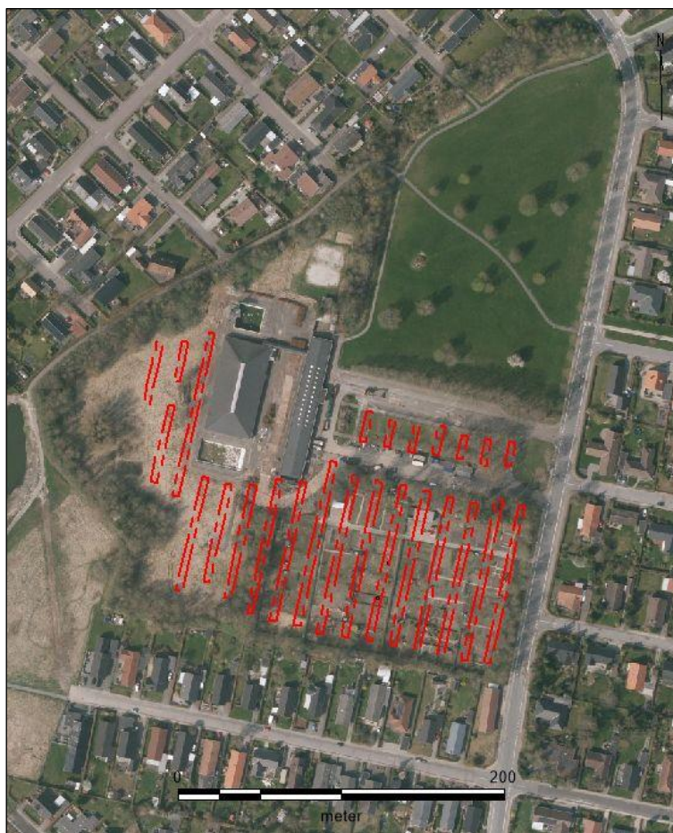
Figur 5. De 25 omtrent nordsyd-gående søgegrøfter.

Det var kun muligt at anlægge søgegrøfter på den vestlige og sydlige del af det i alt 8,3 hektar store lokalplansområde, da parken nord for Kærsmindbadet skulle bibeholdes, og arealerne hvor svømmebadet, tilkørselsveje osv. var fjernet, og derfor ikke længere havde nogen arkæologisk relevans.