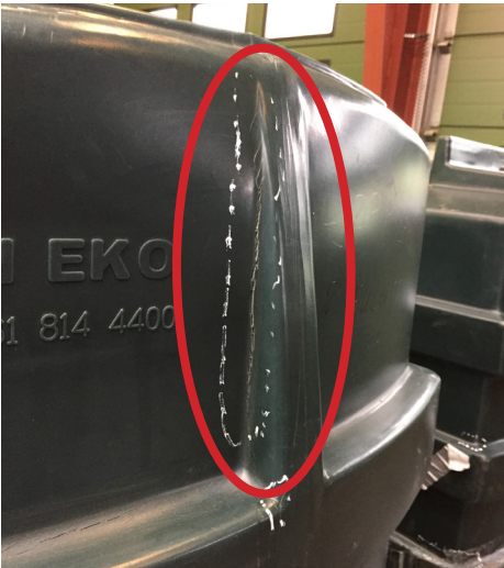
Revnedannelse ved lodret indadgående hulning