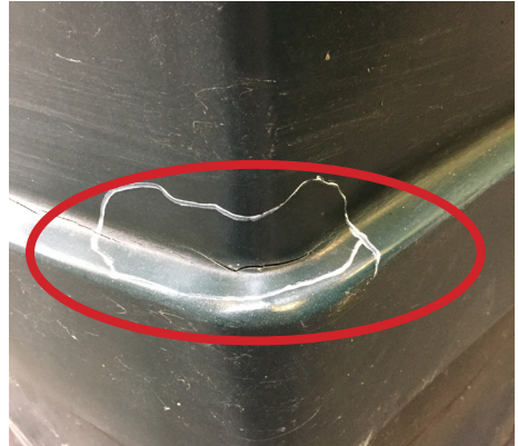
Revne opstået i indadgående hulning