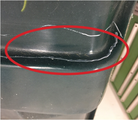
Krakelering samt begyndende revnedannelse i hulning