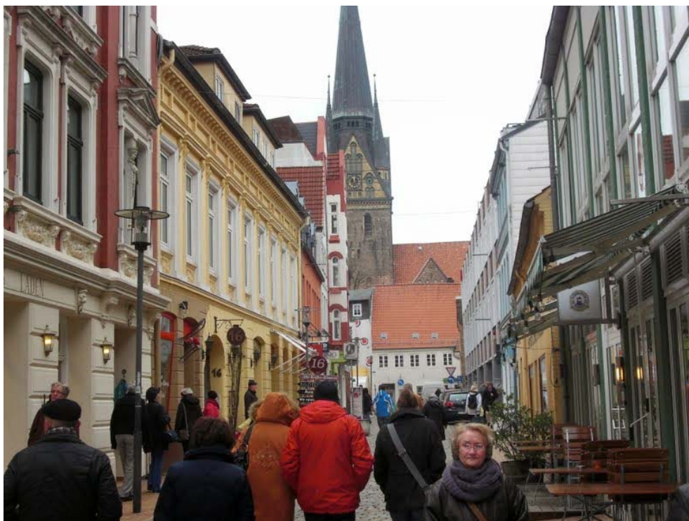
Rote Strasse, Flensburg