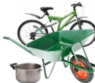
Jern og metal