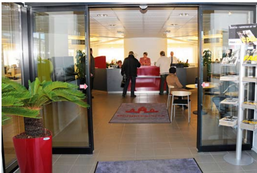
I august 2008 indviede Randers Kommune en ny borgerservice.

2008 var også året, hvor Byrådet besluttede at lade det tidligere rådhus i Langå blive på kommunale hænder. I samarbejde med de gode kræfter i Lokal-Samfundet i Langå er der derfor lavet et stort forarbejde for at afklare økono-