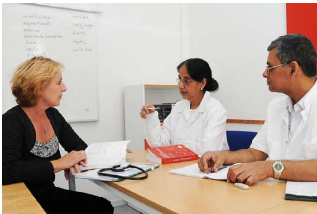
Udlændinge skal sikres let adgang til integration til arbejdsmarkedet.

Der er tale om et samarbejdsprojekt mellem flere parter, hvilket giver mig anledning til at fremhæve, at vi i Randers har tradition for et godt samarbejde med arbejdsmarkedets parter, hvilket er uhyre vigtigt, når vi skal nå de mål, vi har sat os.