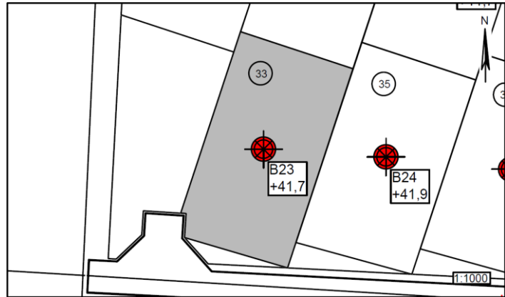
Figur 1 – Situationsplan 1:1000

Parcel nr.: 33 Boring nr.: B23 Overside bæredygtige lag (OSBL), kote: +41,1 Dybde til OSBL, m: 0,60